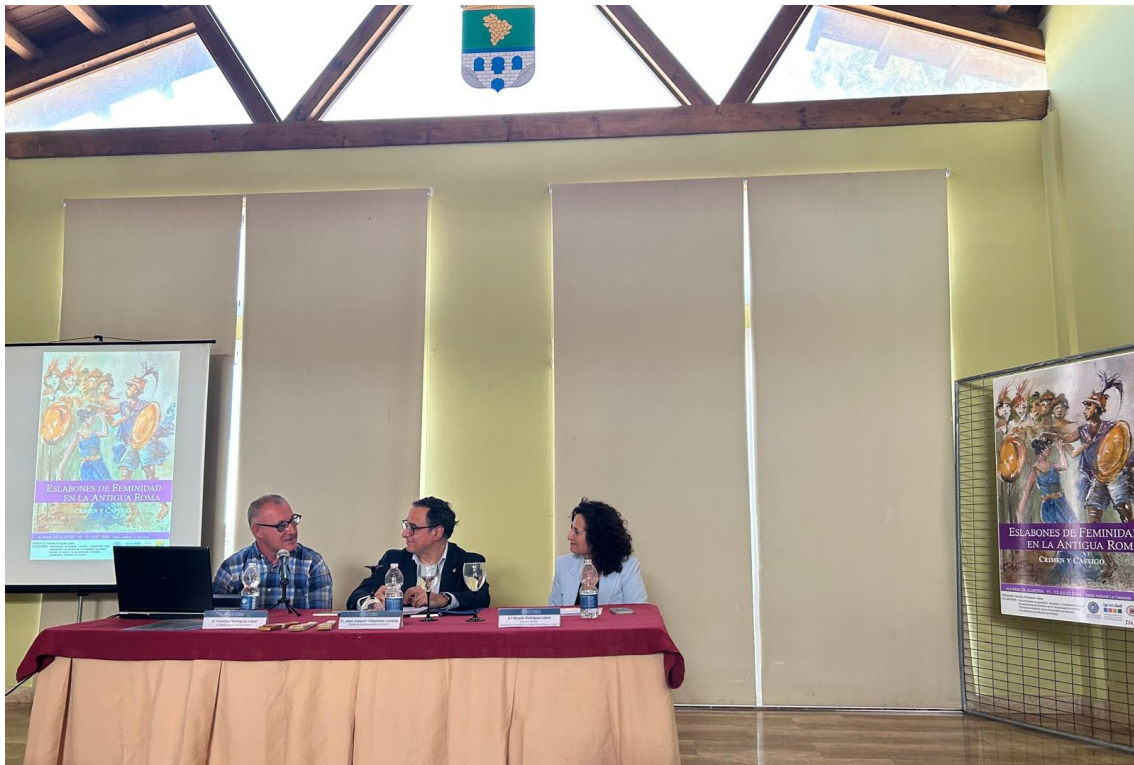
Inauguración a cargo del Rector de la Universidad de Almería, junto a Alcalde de Alhama de Almería y a Directora de las Jornadas